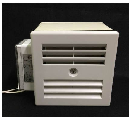
タイマーを側面に貼付け