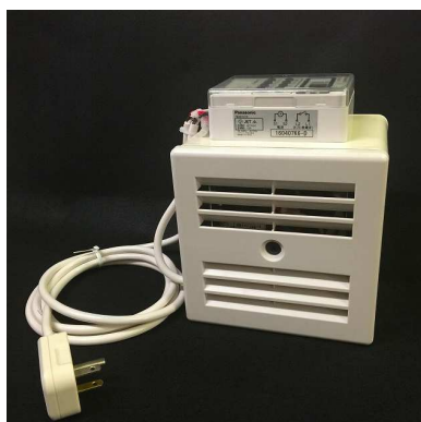
タイマーを上面に貼付け