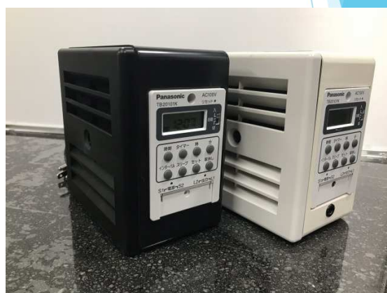
RSN-1509タイマー埋込（黒・白）